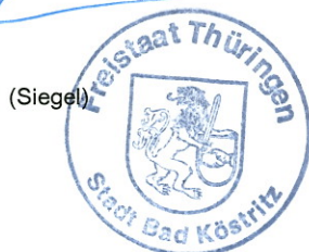
Dietrich Heiland Bürgermeister