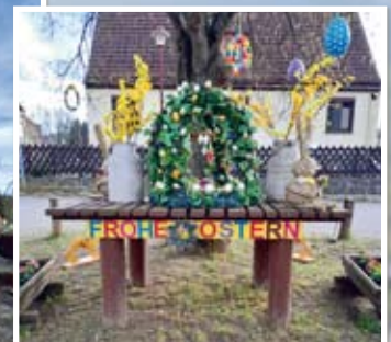
Osterdeko in Pohlitz