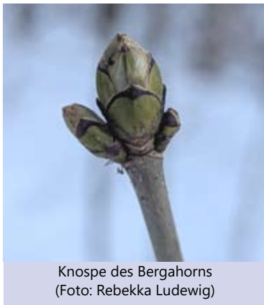
Knospe des Bergahorns

Ende März liegt dieser besondere Zauber in der Luft. Die Sonne gewinnt an Kraft, die Böden duften feucht und lebendig – und an Sträuchern und Bäumen schwellen die ersten Knospen. Noch sind sie unscheinbar, fest geschlossen, doch in ihrem Inneren pulsiert bereits das ganze Versprechen des Frühlings.