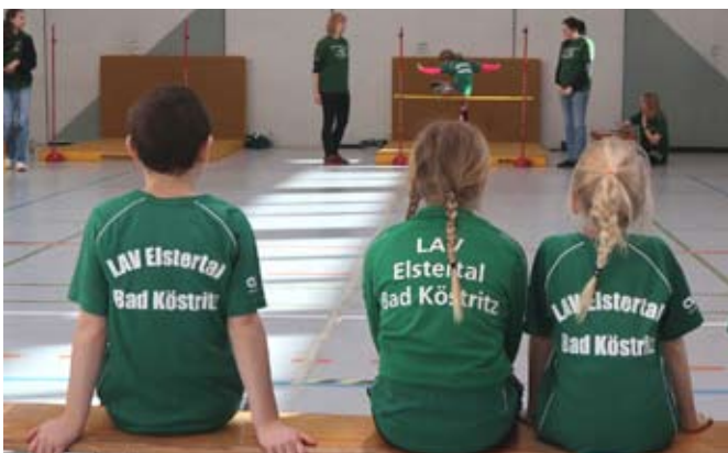
Unsere Athleten im Fokus.

Insgesamt nahmen Teams aus fünf Vereinen teil: LAV Elstertal Bad Köstritz, SV Gera, LV Gera, SV Hermsdorf und LC Jena. Die jungen Athletinnen und Athleten der Altersklassen U8, U10 und U12 traten in verschiedenen Disziplinen wie 30 m Sprint mit fliegendem Start und Lichtschranke, Hindernissprint-Staffel, Sprung- und Stoßwettbewerben gegeneinander an.